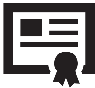
Tableau des défis

Adoptez un objet promotionnel, un slogan, une citation qui représente votre équipe de travail.